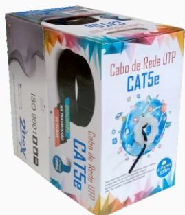
Cabo De Rede CaT5e