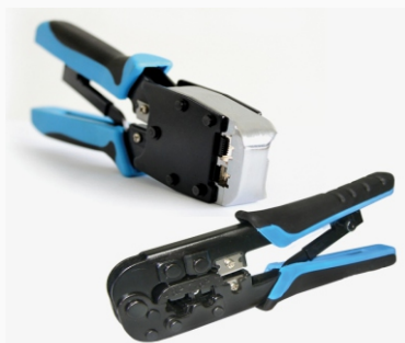
Alicate de Crimpar