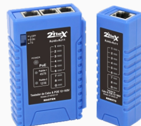
Testador de Cabos