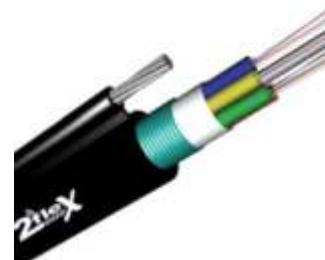
Cabo Óptico FIG 8