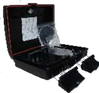
CTO – Terminação Óptica