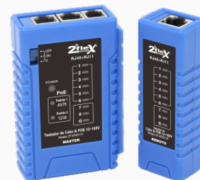
Testador de Cabos