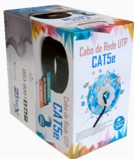
Cabo De Rede CaT5e